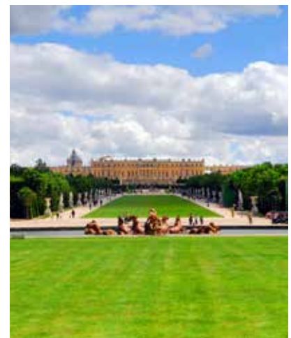
Palacio de Versalles.