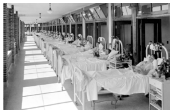
Enfermos de tuberculosis en un sanatorio.